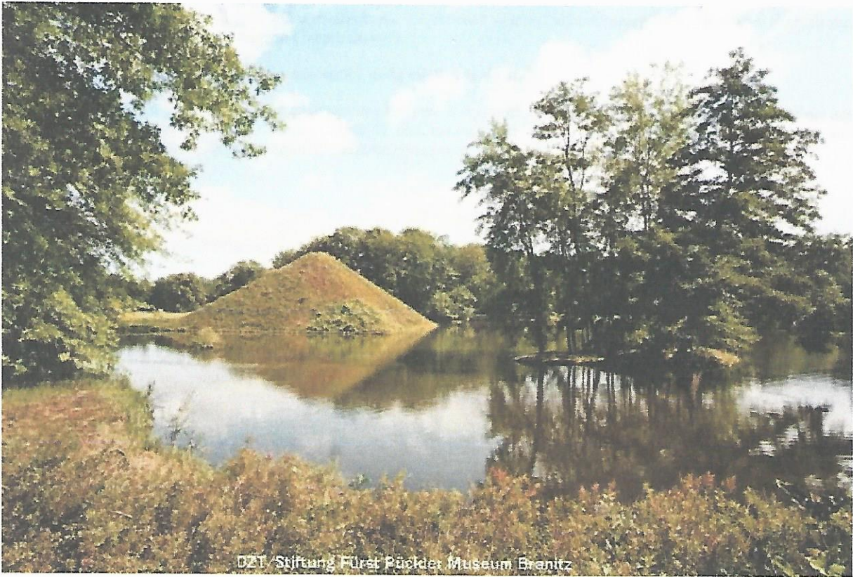
DZT / Stiftung Fürst Pückler Museum Branitz